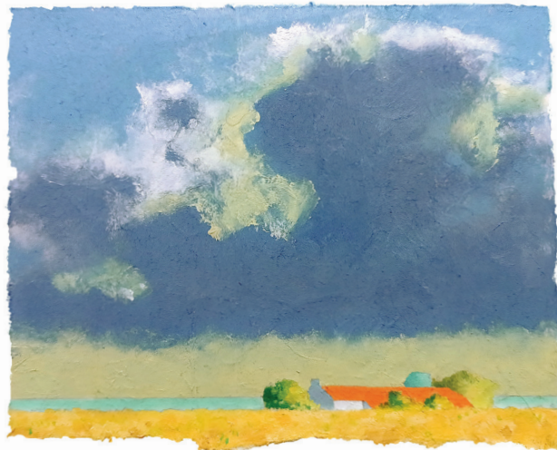
„Wolken überm Kornfeld“, Ölskizze, 2025

Titelbild: „Winternachmittag“, Öl auf Leinwand, 80 x 90 cm, 2025 (Ausschnitt)