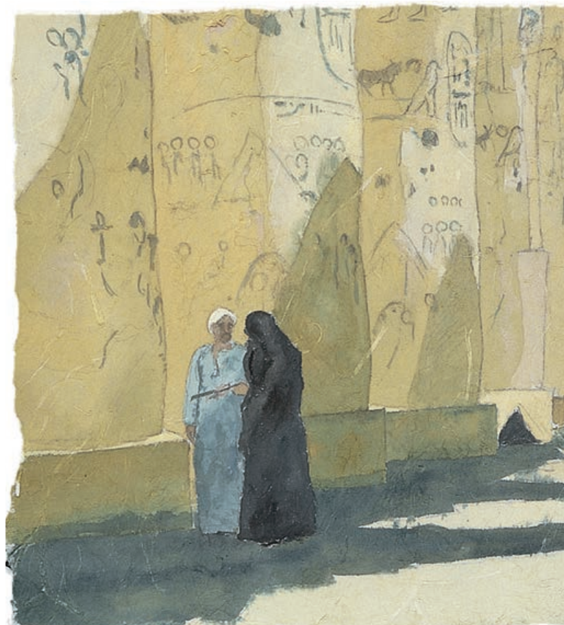
Gespräch im Tempel, Aquarell auf Japanpapier, 1987