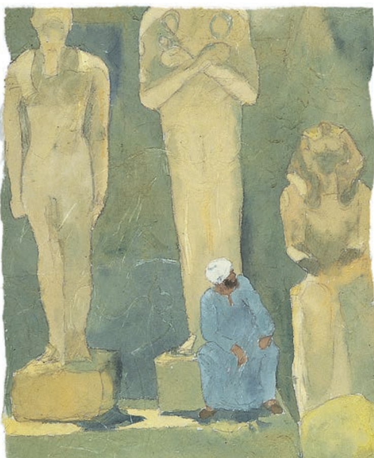
Tempelwächter, Aquarell auf Japanpapier, 1987