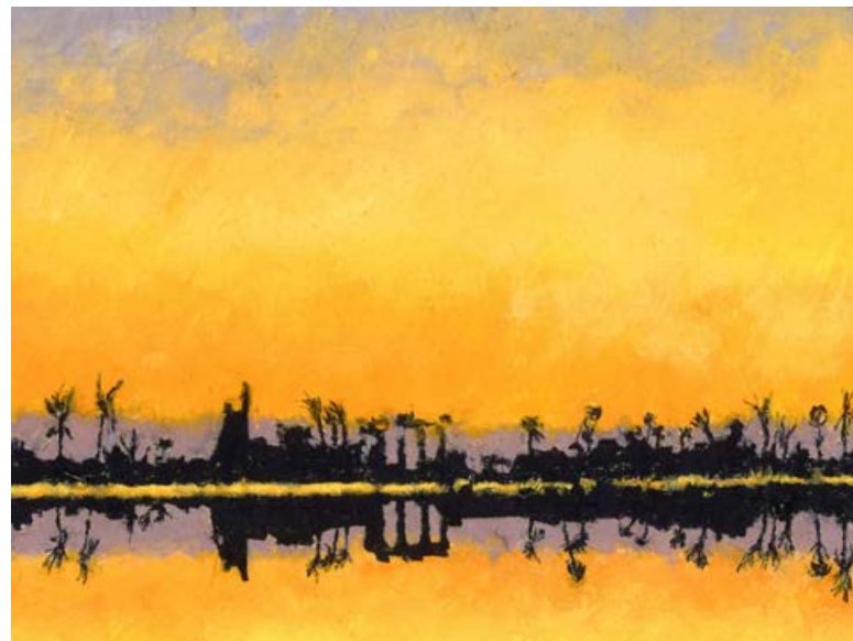
Sonnenaufgang, Öl auf Japanpapier, 2022

Erst etwa 30 Jahre später bin ich 2018 und dann 2021 wieder in Ägypten gewesen und außer Bleistiftzeichnungen im Skizzenbuch ist eine Reihe kleinformatiger Ölarbeiten auf Japanpapier entstanden.