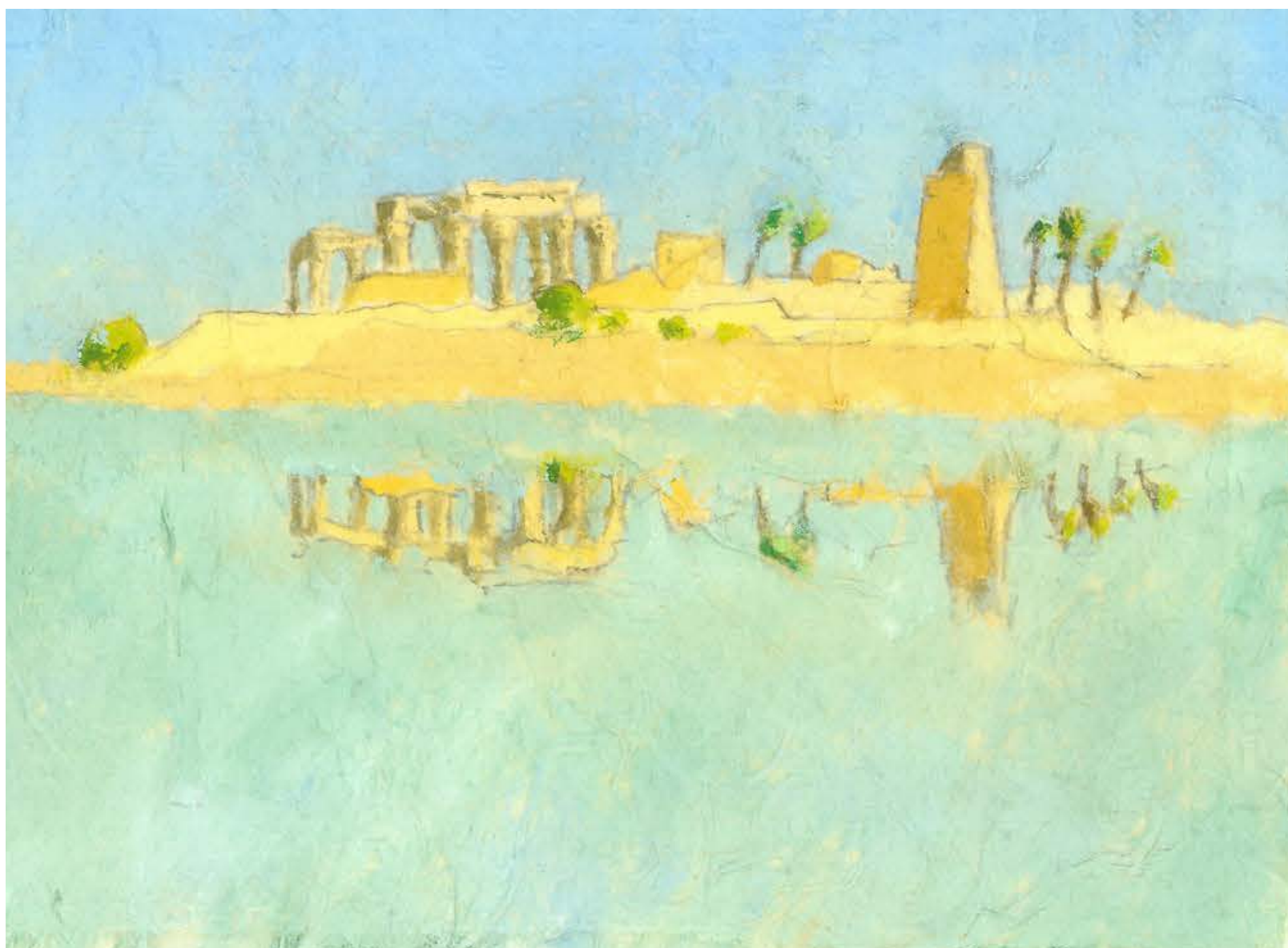
Wasserspiegelung - Kom Ombo Tempel, Öl auf Japanpapier, 2021