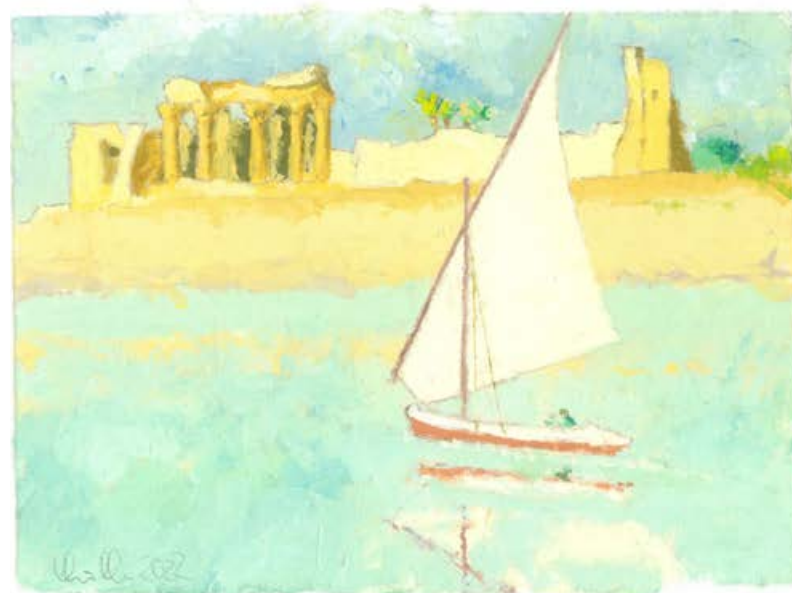
Segler II, Öl auf Japanpapier, 2021